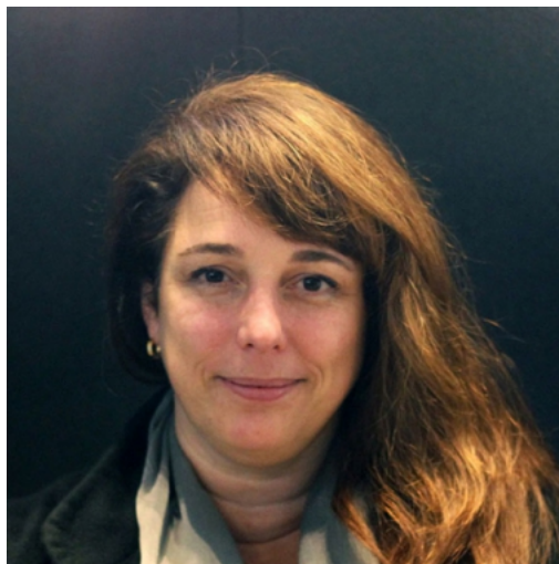
Tania Bruguera.